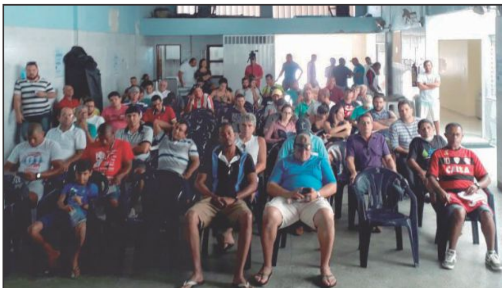
▲ Trabalhadores da Deso, da Capital e do Interior, participaram da assembleia

Depois de algumas discussões, foi seguida a Cartilha do ACT 2016/2017, lendo-se cláusula por cláusula, fazendo as alterações necessárias e incluindo