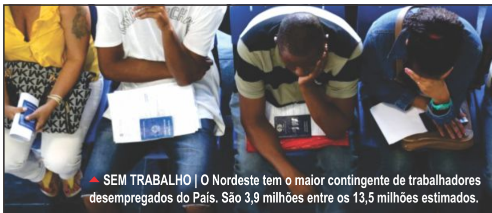
▲ SEM TRABALHO | O Nordeste tem o maior contingente de trabalhadores desempregados do País. São 3,9 milhões entre os 13,5 milhões estimados.

zar parte da Petrobrás, todo o sistema Eletrobrás e a Casa da Moeda, entre outros, a CUT apoia e participa do Dia de Luta pela Soberania que acontecerá no dia 03 de outubro no Rio de Janeiro. A data é representativa pois a Petrobrás, principal empresa estatal do país e orgulho dos brasileiros, completa 64 anos de existência e resistência.