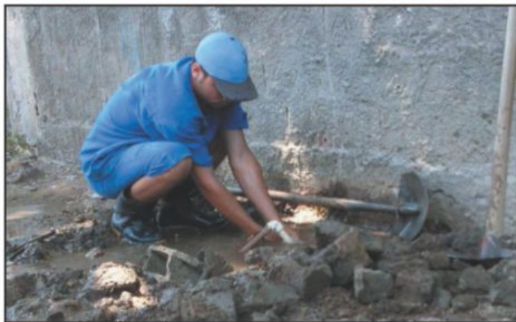
▲ Tem cliente da Deso que espera há um ano para ter a sua água ligada

Diante de tantos problemas, a que se perguntar: as terceirizações desenfreadas são realmente mais eficientes e mais produtivas para a Companhia? Elas estão sendo úteis exatamente para quem? Como fica o nome da Deso, perante a população, diante de tantos serviços mal executados por terceirizadas?