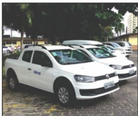
▲ Local de guardar os carros é nos pátios da Deso

Mesmo com as denúncias regulares feitas pelo sindicato sobre o uso irregular ou abusivo dos veículos locados pela Deso, as coisas só pioram a cada momento. Sabe-se que pelas normas internas do Setor de Transporte, esses veículos não podem pernoitar na casa de funcionário, devendo ser recolhidos ao pátio da Sede, na Capital, e aos escritórios de atendimento e Regionais, no caso das cidades do interior. Na prática, isso não vem acontecendo.