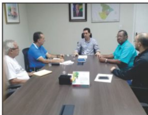
▲ Reunião como o novo diretor-presidente foi bastante produtiva, discutindo pleitos da categoria