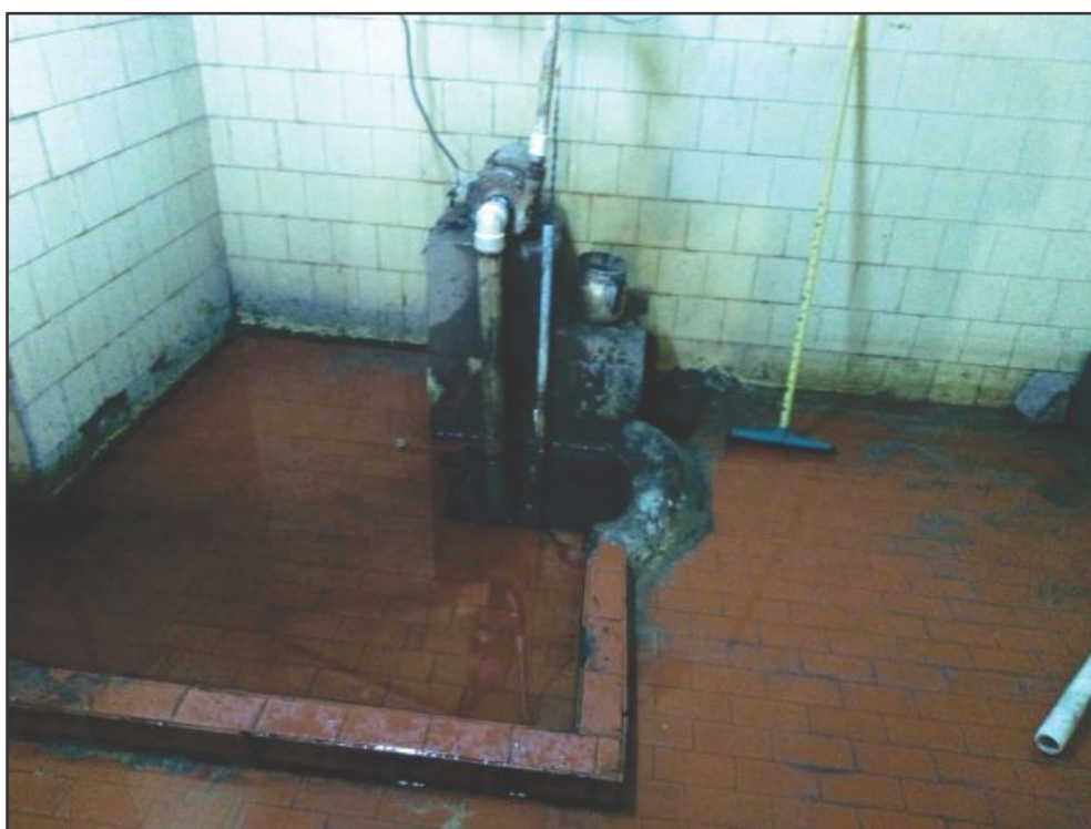
▲ Com vários vazamentos, salas da unidade vivem cheias de água, podendo haver curtos elétricos

Todas essas irregularidades fazem parte do que hoje é o R-1. Os Operadores oram a Deus todos os dias nos seus plantões para que nunca acon-