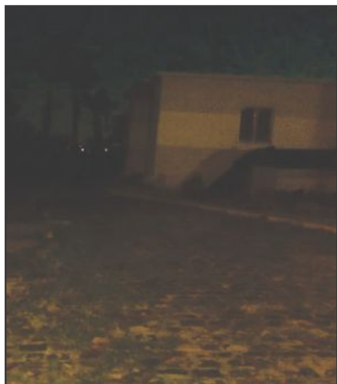
▲ Durante a noite, a escuridão toma conta da unidade, num cenário de total abandono

Pedimos aos responsáveis pela área que façam uma visita cuidadosa ao R-1 e tirem lá as suas conclusões. Confirmam se trata-se de exagero o que aqui está sendo relatado.