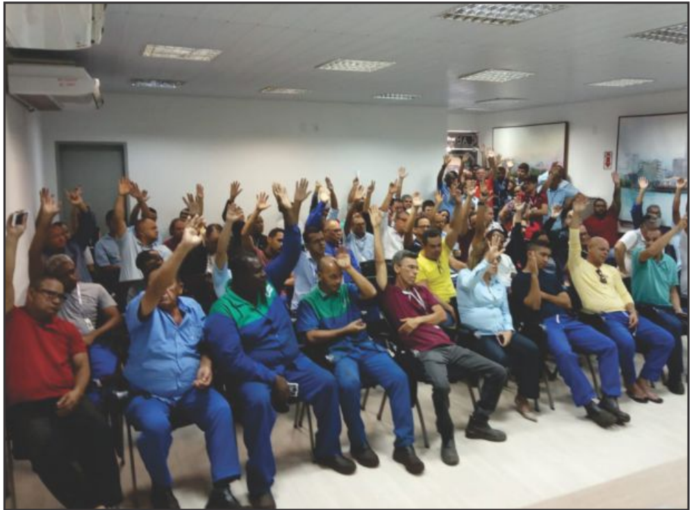
▲ Trabalhadores dizem SIM à Greve Geral contra o desmonte da Previdência e do patrimônio público