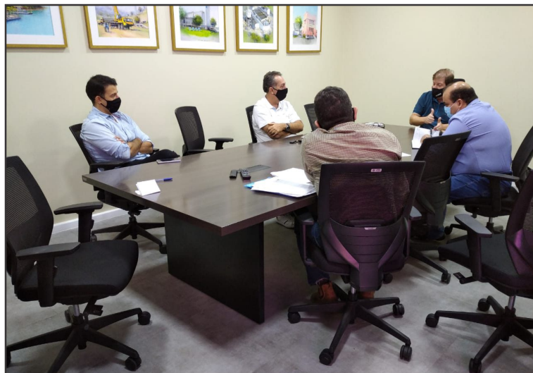
▲ Reunião na DESO tratou de pautas de interesse da categoria

O SINDISAN continuará na luta em defesa da preservação da saúde e das vidas dos trabalhadores e trabalhadoras,